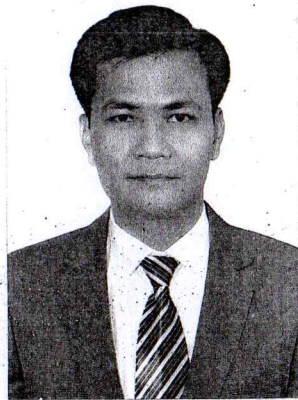
Given under the Seal of the State Council for Professorship

CHỨNG THỰC ĐẠT TIÊU CHUẨN CHỨC DANH PHÓ GIÁO SƯ BẢN SAO ĐÚNG VỚI BẢN CHÍNH